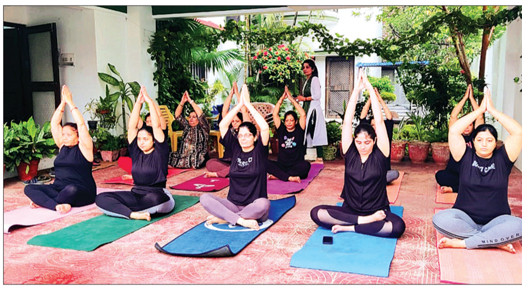
क्रिया। मंत्री सिलावट ने शहरवासियों के साथ योग नृत्य किया और जमकर योग ठहाके लगाए।